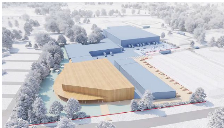
En bleu les surfaces industrielles. En marron les surfaces commerciales et tertiaires

Le projet IKOS consiste en la création d'un lieu vitrine de l'économie sociale et solidaire en matière de réemploi rassemblant plusieurs acteurs de ce domaine fédérés par l'association IKOS. Il associera des activités productives et des espaces commerciaux dans de nouveaux bâtiments de plus de 12 000 m 2 . Le projet évalué à 18,5 M€ s'appuie sur des subventions publiques (ADEME, Conseil Régional Nouvelle-Aquitaine, FEDER et Bordeaux Métropole) à hauteur de 6,5 millions d'euros, mais également sur des emprunts pour 8 millions d'euros et des fonds propres à hauteur de 4 millions d'euros.