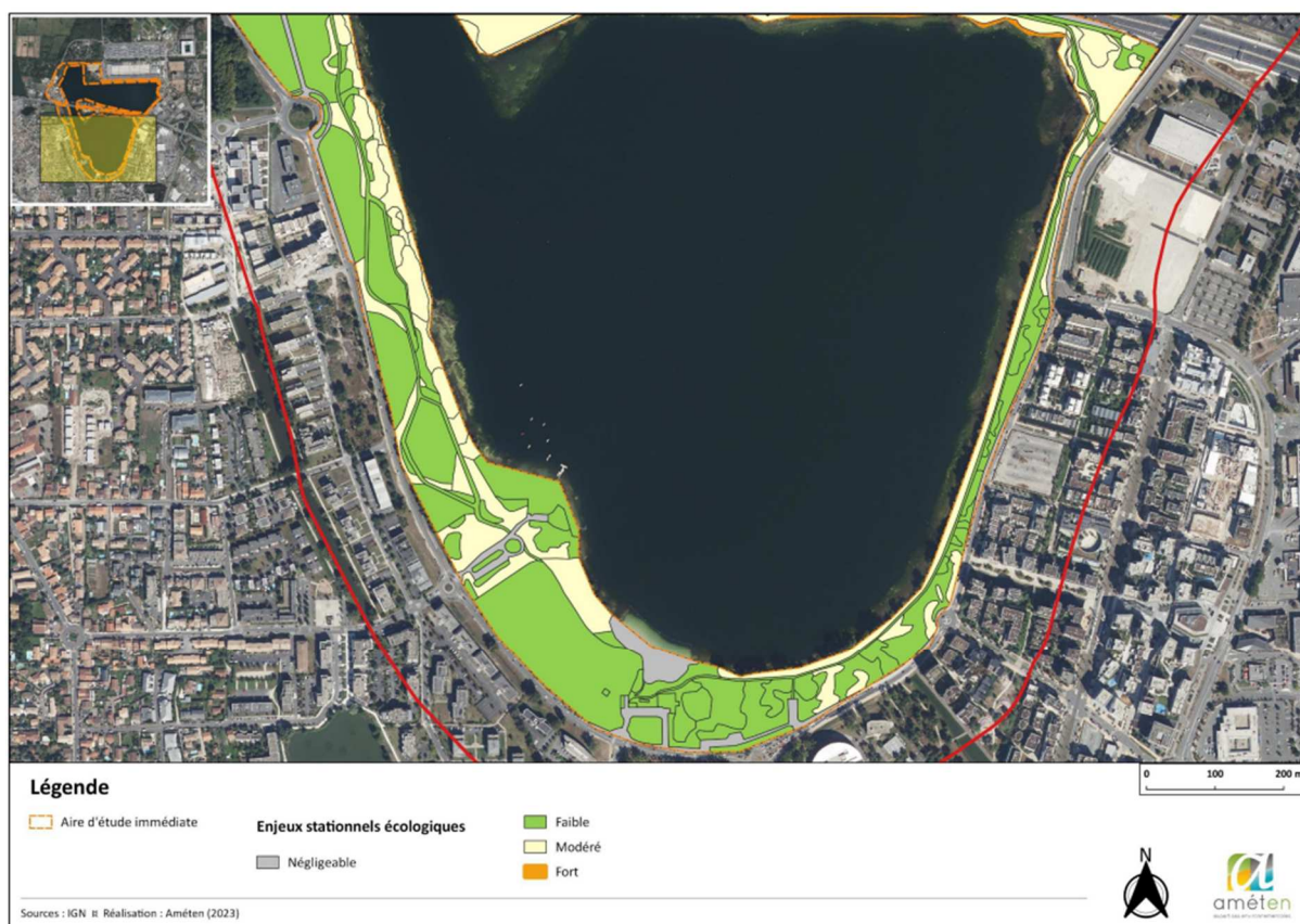
Cartographie 112 : Enjeux stationnels au sein de l'aire d'étude immédiate – Sud de l'aire d'étude.

La cartographie est issue du diagnostic écologique réalisé en 2023 par le bureau d'étude AMÉTEN mandaté par Bordeaux Métropole.