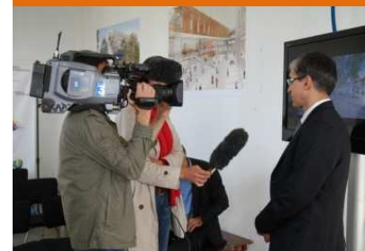
CONFÉRENCE DE PRESSE