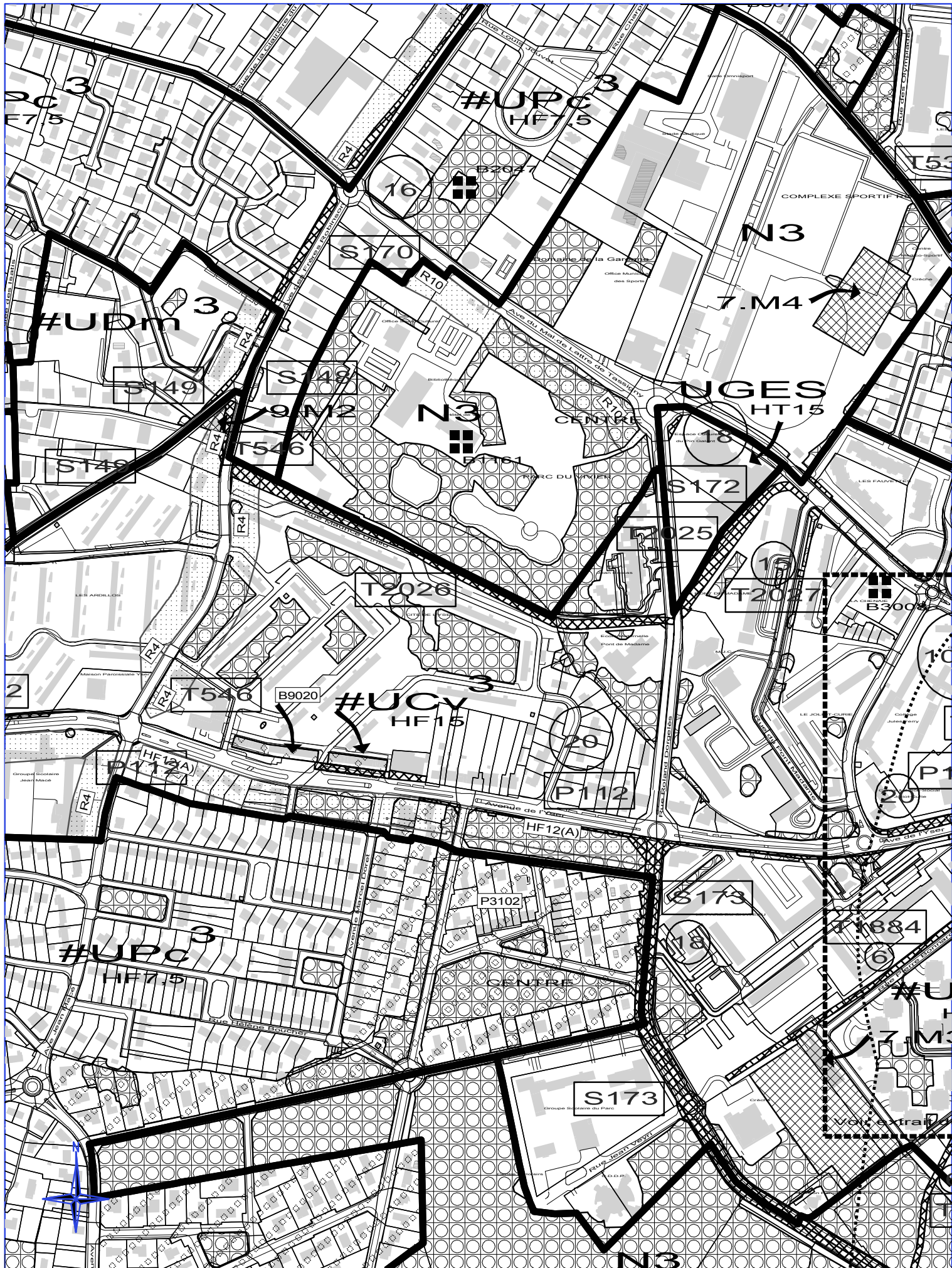
- Mérignac - Yser - version en vigueur